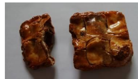
お徳用無選別 角餅