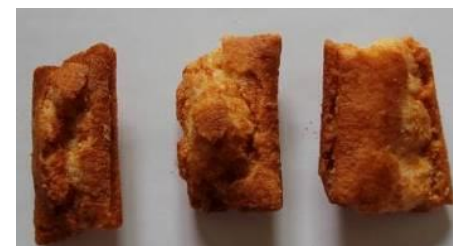
いぶし銀 ドラ付き醤油

編集後記 六月を迎え暑い日が増えてきました。これから七月八月になると朝から夜まで汗が絶え間なく出てくる季節です。すると皆さんしょっぱいものを食べて熱中症にならないように注意しましょう。ということと熱中症に良いお煎餅を二種類紹介いたします。まずは正統派醤油シミみお煎餅【お徳用無選別 角餅】です。買うときに割れている煎餅がたくさん入っていて内側まで醤油がしみ込んでいる袋を探して買うのがコツです。ヤオコーでもセイムスでも売っています。しみ込んだ醤油が噛んだ時に口の中で出てきて最高に幸せになります。歯の悪い人には【いぶし銀 ドラ付き醤油】食べる前から香ばしい醤油の香りがたまりません。ヤオコーで購入できます。是非試してください。 (広報 真野)