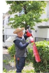
【緑の委員会による事前刈込】