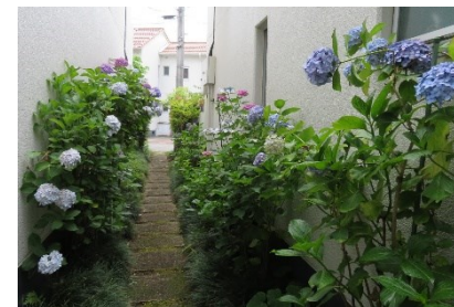
紫陽花や 今日の嘘 子規

編集後記 武蔵野銀行開催の「相続・遺言セミナー」に参加しました。 残す財産が有る訳でもないのですが、相続時に起きるトラブルを聞くことが多くなってきました。 仲の良かった兄弟が突然の絶縁!小さな従妹同士は訳もわからず遊べなくなってしまう。「相続」は税金の問題より人間関係の問題が大きいです。遺産相続で裁判になる様なトラブルが、遺産額一千万円以下で三割以上、5千万円以下でも7割以上を占めているとの事です。過疎地の実家(空き家)が、今までは資産と想っていても実際には「売れない」「貸せない」「壊せない」様な場合が多い様です。感情の話し合いにならないために『準備・解決法』を考えておく必要を実感しました。 (広報 山口)