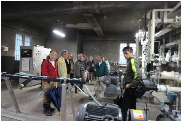
ポンプ室見学の様子