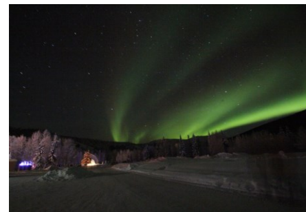
写真に撮ると緑のオーロラ

編集後記 十一月にオーロラを見にアラスカに行きます。シアトルからさらに四時間飛行機に乗ってアラスカ州のフェアバンクスに向かいます。フェアバンクスからは宿の車に迎いかいに来てもらってさらに百二十キロ、二時間の野中の一軒宿です。公共の電気も水道も電話もないのですが、ディーゼル発電設備、井戸、微生物下水処理施設、衛星電話そして何より温泉があるので真冬にはマイナス三十五度になりますが室内は快適です。この宿から北に行く道は行き止まりで自家用の飛行場があります。と言っても管制塔も照明もない平らな野原があるだけです。夜になるとこの飛行場の滑走路に椅子を持って行ってオーロラを見るのです。というかオーロラが出現するのをひたすら待つのです。太陽風から発生するプラズマが地球の磁力線にぶつかってオーロラが発生するといわれていますが実はその原理は解明されていないそうです。皆さんオーロラは緑や赤かと思っっていると思いますが、実は白いです。しかし、写真にとると緑になります。プラズマっていうやつは特性でしょうか? 実は、写真に二回この地を訪問して白いオーロラを見ました。宿にメールを送って肉眼で緑や赤のオーロラが見えることがあるのか聞いたところまれば見えないかというニュースがありました。その時は見えたらしいです。今回見えたらしいのですが、興味のある方はインターネットで「チェナ温泉リゾート」と検索してみてください。日本語のホームページを見ることが出来ます。 (広報 真野)