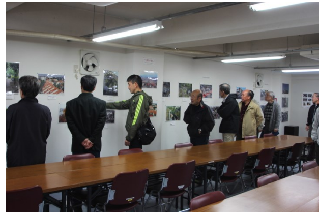
管理組合第三集会場の見学