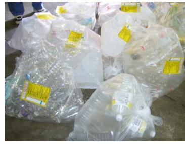
未回収のペットボトル

ゴミ集積所の点検は、地区委員（環境保全担当）の方がゴミ回収時の状況（回収日でないゴミ、回収後に出しているゴミ）を確認し、注意喚起を実施しています。6 月 度 の ゴ ミ 違 反 数 は 6 1 件 確 認 さ れ ま し た 。 うち回収後に出しているゴミ違反は、26 件 でした。