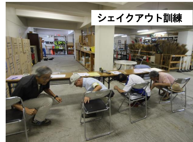
シェイクアウト訓練