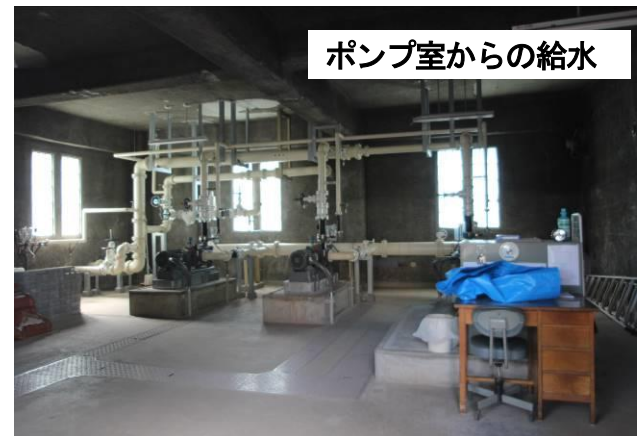
ポンプ室からの給水