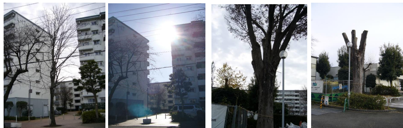
伐採前 4-16と4-17の間 伐採後

1月30日（水曜日）から、2月1日（金曜日）の3日間でケヤキ4本の強剪定と栃ノ木2本の伐採が行われました。前日まで強い風が吹いていましたが天候にも恵まれ車、バイクの移動や、通行止め、う回路等の住民の協力によりスムーズに安全に作業が完了しました。