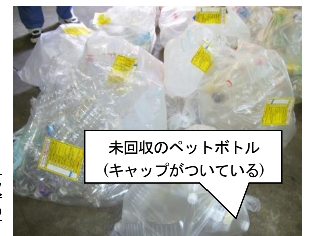
未回収のペットボトル（キャップがついている）

◎広報にペットボトル、プラスチック、びん・缶・乾電池、古紙・古布、もやさないゴミの収集日を記載していますので良く確認の上その日に収集するゴミを出してください。