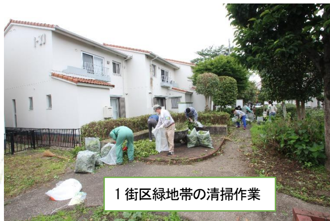
1街区緑地帯の清掃作業

管理事務所で必要な用具の貸し出しを、1年を通して行っていますので用具の必要な方は窓口までお越しください。