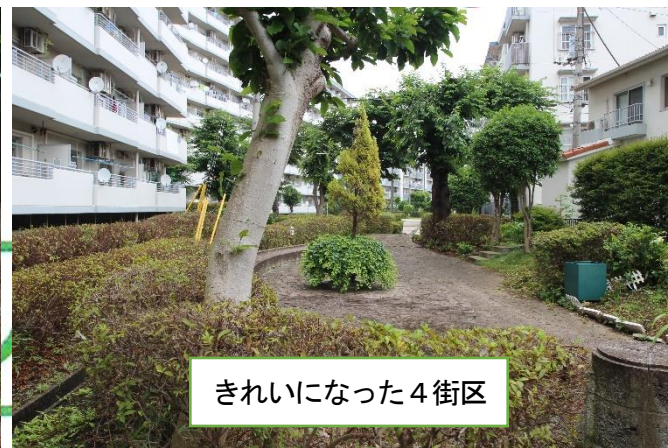
きれいになった4街区