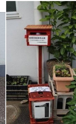
時間外駐車場申込票 入りボックス