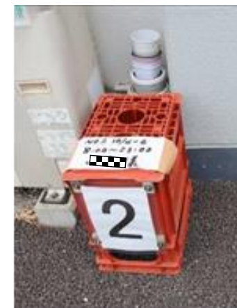
使用中駐車場の表記

使用中の駐車場は以下の写真のように使用期間と使用者名が表示されています。窓口が開いていない時間に緊急に使用する場合はささえ愛つつじ野の入り口の左横に時間外駐車場申込票が入った赤いボックスがありますので、申込票に記入して駐車中は自分の車のダッシュボードにおいてください。そして使用料金を管理組合窓口で、後日お支払いください。