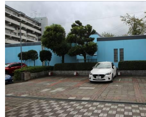
管理組合建物の西側駐車場

利用料金は、8:00~24:00までが200円、0:00~8:00までが300円です。管理組合窓口で申し込んでください。