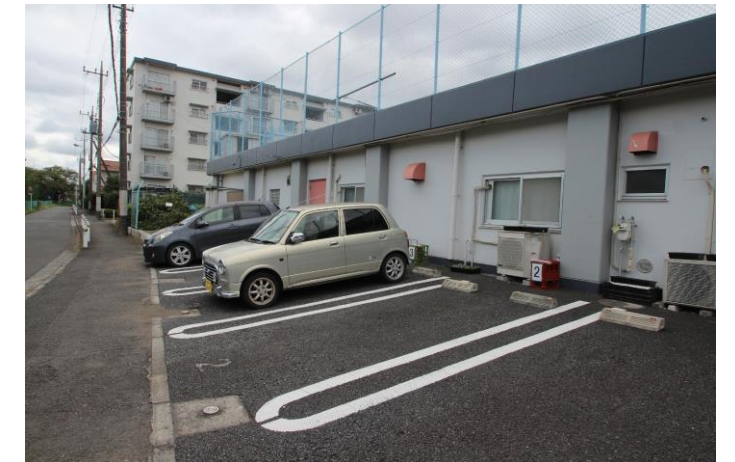
管理組合建物の東側駐車場

使用中の駐車場は以下の写真のように使用期間と使用者名が表示されています。窓口が開いていない時間に緊急に使用する場合はささえ愛つつじ野の入り口の左横に時間外駐車場申込票が入った赤いボックスがありますので、申込票に記入して駐車中は自分の車のダッシュボードにおいてください。そして使用料金を管理組合窓口で、後日お支払いください。