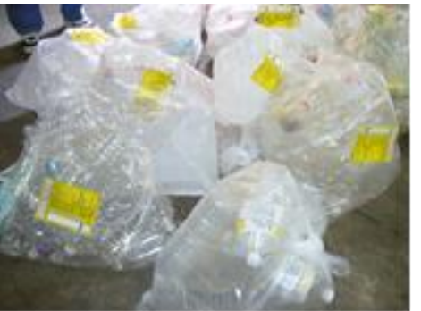
蓋・ラベルはプラスチックごみ

● ペットボトルのゴミ出しでは、蓋をしたままのペットボトル、ラベルを剥がしていないペットボトル、洗剤、シャンプーなどのプラスチック容器が入っていると狭山市は、回収してくれません。そのままその場に取残されてしまいます。写真のような取残されたゴミは、美観を損ね虫が湧くなど大変なことになります。これらのゴミは、地区委員や防犯パトロール隊、また管理組合を通してシルバーさんをお願いして清掃作業・再分別・保管を行い、ゴミ出し指定日に出されます。一人の無責任な行動が多くの人々の手間を発生させ管理費が無駄に使われています。これらの作業が増えると清掃費用が増大し無駄な管理費を使うことになります。タバコの吸い殻の投げ捨ても、捨てた人以外の人達の手間・管理費で処理されることになります。